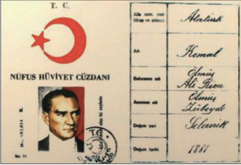
Mustafa Kemal Atatürk'ün Nüfus Cüzdanı

Mustafa Kemal Atatürk'ün nüfus cüzdanı dikkate alındığında;