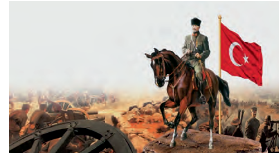
30 Ağustos Zafer Bayramı