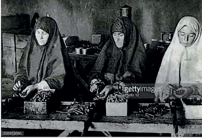
Mermi dolmayan Türk kadınları

Milli Mücadele yıllarında milletimiz; genç, ihtiyar, kadın erkek demeden bağımsızlık mücadelesi vermiştir. Bu mücadelede kadınlarımız da önemli işler başarmıştır.