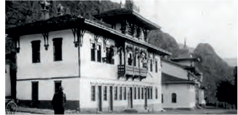
Amasya Genelgesi'nin hazırlandığı Amasya Saraydüzü Kışlası