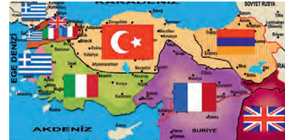
Sevr Antlaşması- Toprak Paylaşımı

Sevr Antlaşması: (10 Ağustos 1920): İtilaf Devletleri ile Osmanlı Devleti arasında imzalanan bu antlaşmayla düşmanlar yurdumuzu paylaşmışlardı. Fakat TBMM bu antlaşmayı kabul etmedi.