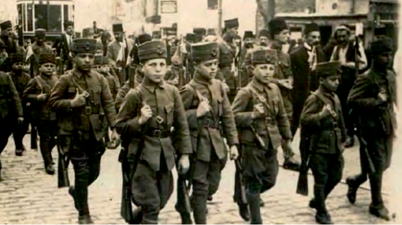
Çanakkale Savaşında Cepheye Giden Çocuklar-1915