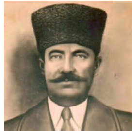
Kazım Karabekir (Doğu Cephesi)