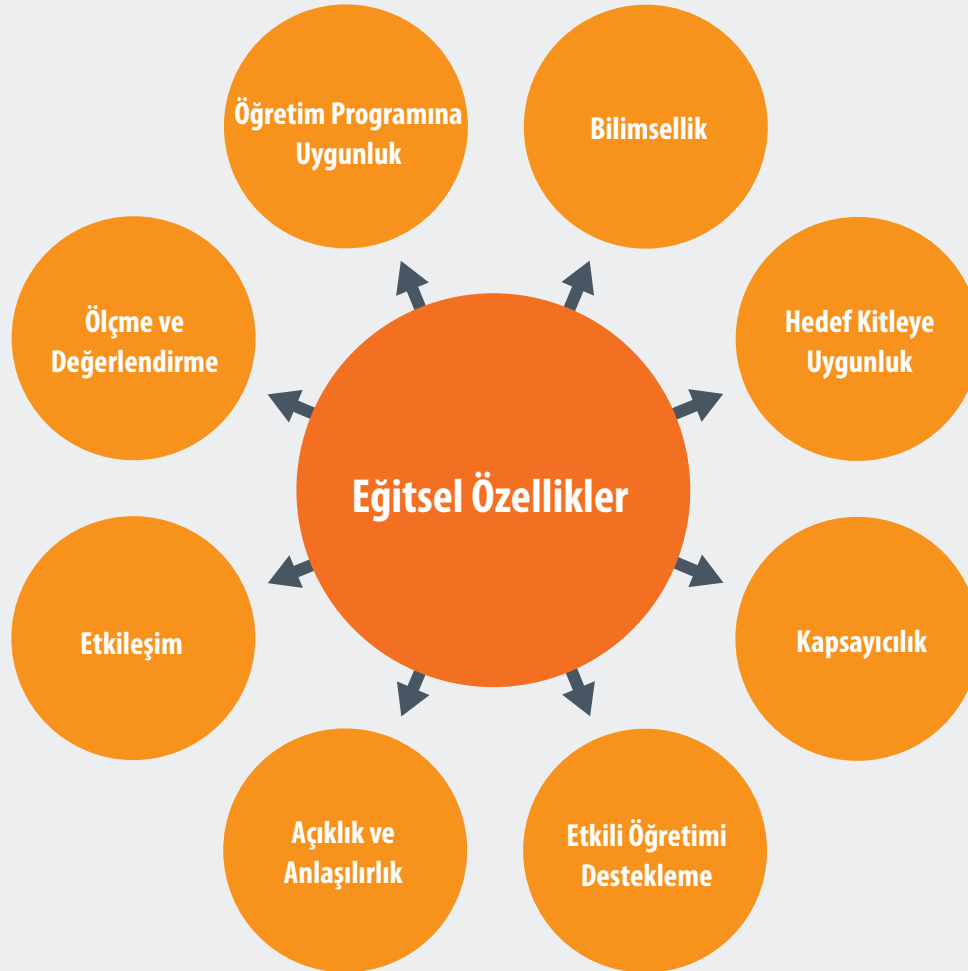
Şekil 2. E-içeriklerde bulunması gereken eğitsel özellikler

Eğitsel özellikler, e-içeriklerin geliştirilmesinde hem hedef kitlenin ilgi ve ihtiyaçlarına cevap vermek hem de öğrenme amaçlarına en etkili şekilde ulaşmak için dikkate alınması gereken özelliklerdir. Bu bölümde öğrenme kuramları ve iyi uygulamalardan yola çıkılarak, e-içeriklerin öğretim programına uygun olması, bilimsel standartlara dayandırılması, hedef kitleye uygun ve kapsayıcı olması, etkili öğretimi desteklemesi, açık ve anlaşılır olması, etkileşimli olması ve e-içeriklerde ölçme-değerlendirme uygulamaları gibi eğitsel özellikler ele alınmıştır (Şekil 2). Sıralanan eğitsel özellikler, kaliteli e-içerikler geliştirilmesine dolayısıyla etkili ve verimli bir öğrenme/öğretme deneyimi oluşmasına rehberlik edecektir.