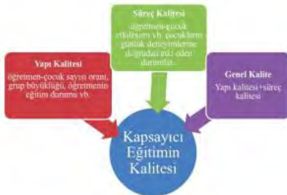
Şekil 10. Kapsayıcı eğitimin kalitesi