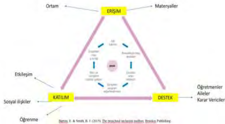
Şekil 11. Kaliteli kapsayıcı eğitimin bileşenleri