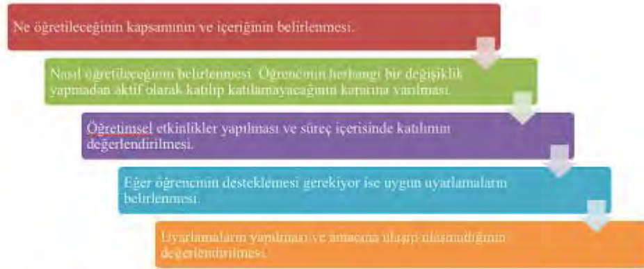
Şekil 5. Uyarlama süreci