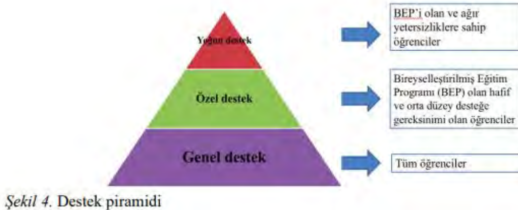
Şekil 4. Destek piramidi