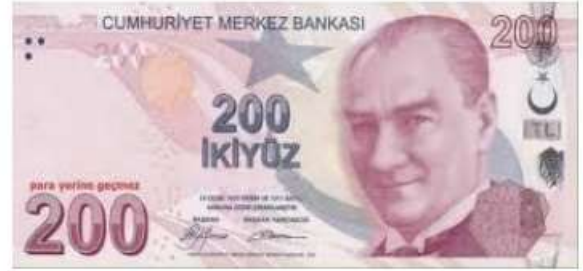
200 Türk Lirası ( 200 TL )

Örnek 1° : Aşağıdaki paralarla alabileceğiniz eşyaları eşleştiriniz.