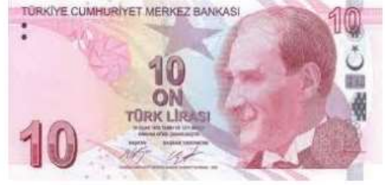
10 Türk Lirası ( 10 TL )