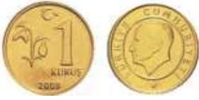
1 kuruş ( 1 kr. )