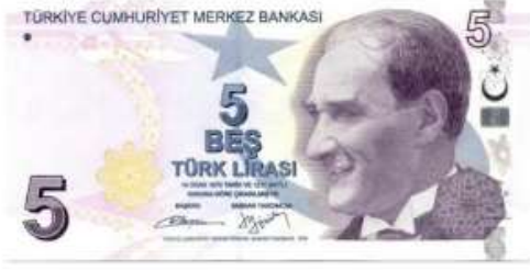
5 Türk Lirası ( 5 TL )