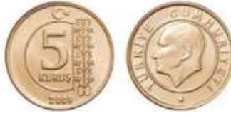
5 kuruş ( 5 kr. )