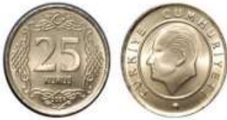
25 kuruş ( 25 kr. )