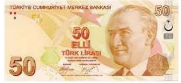
50 Türk Lirası ( 50 TL )