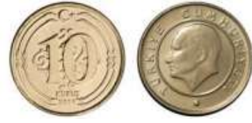
10 kuruş ( 10 kr. )