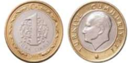
1 Türk Lirası ( 1 TL )

Örnek 1° : Aşağıdaki paralarla alabileceğiniz eşyaları eşleştiriniz.