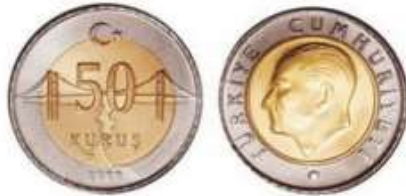
50 kuruş ( 50 kr. )