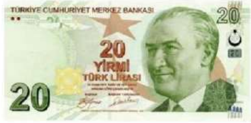
20 Türk Lirası ( 20 TL )