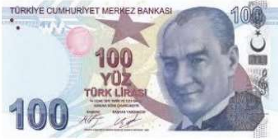
100 Türk Lirası ( 100 TL )