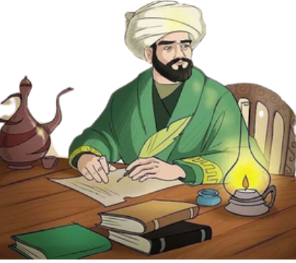
Evliya Çelebi Gezdiği yerleri Seyahatname adlı eserinde toplamıştır.