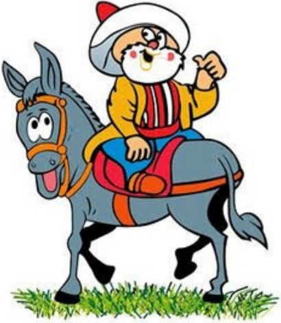
Nasreddin Hoca Fıkralarıyla ünlüdür.