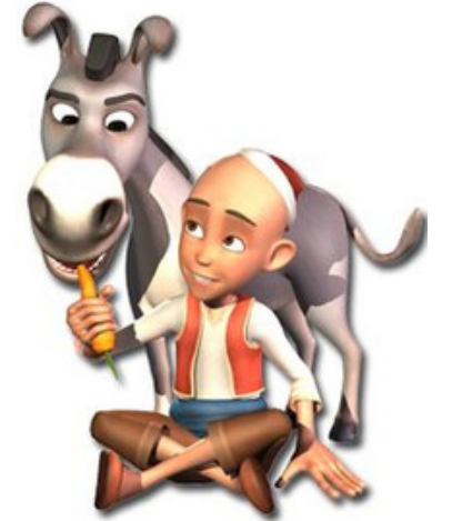
Keloğlan Masal kahramanı