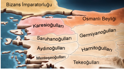
Harita 2: XIV. Yüzyılın İlk Yarısında Anadolu