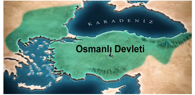
Harita: Ankara Savaşı Sonrası Anadolu