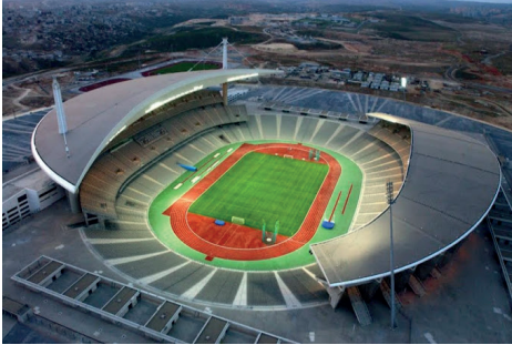
Atatürk Stadyumu Kapasite: 77 563