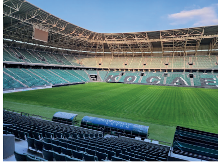
Kocaeli Stadyumu Kapasite: 34 829

Yukarıdaki bilgilerden yararlanarak aşağıdaki soruları cevaplayınız.